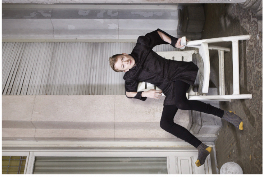
● Warr Kamps voor PS/Parool

Toch weerhoudt dat Jouk niet van haar tijdrovende zoektocht. 'Als ik geluk heb, heb ik zo'n twee huizen achter de hand. Maar als ik echt onder de indruk ben, neem ik niet het risico dat het huis verkocht is als ik het nodig heb. Dan grijp ik mijn kans en bedenik ik een vrij werk.'